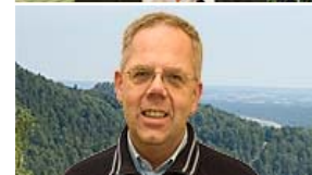
Carl-Otto Swartz, Hushållningssällskapet (ingen bild ännu)